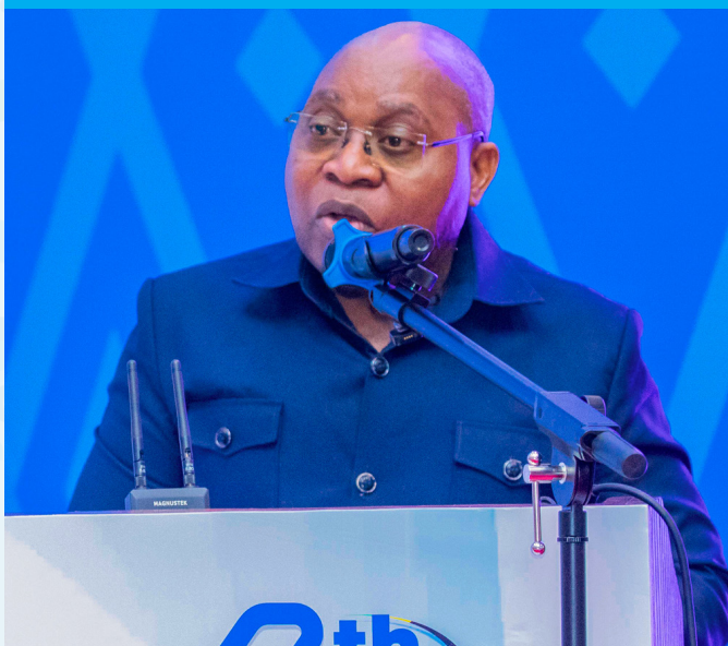
Mwenyekiti wa Kamati ya Kudumu ya Bunge, Utawala, Katiba na Sheria, Dkt. Damas Ndumbaro akizungumza wakati wa kikao kazi cha 6 cha Serikali Mtandao

na msingi katika utoaji wa huduma bora jumuishi na zinazopatikana wakati wote, kukuza vipaji na kutengeneza ajira kwa vijana wabunifu katika eneo la Serikali Mtandao,” amesema.