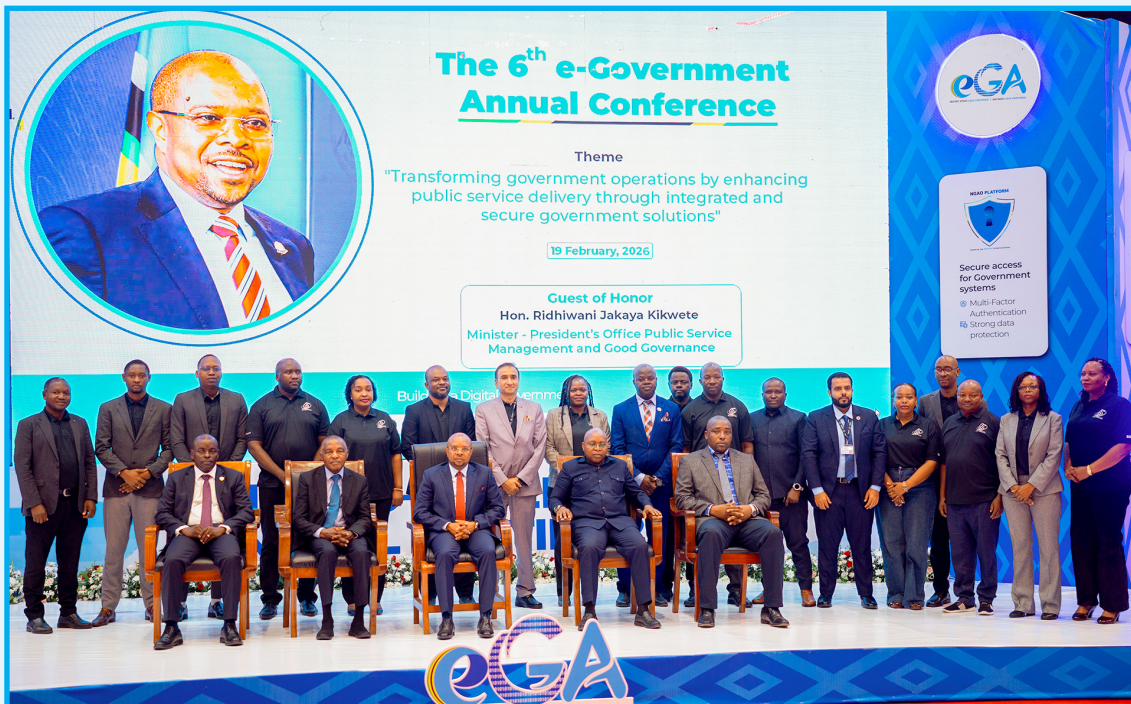
Waziri wa Nchi Ofisi ya Rais, Menejimenti ya Utumishi wa Umma na Utawala Bora Mhe. Ridhiwani Kikwete (Mb) (katikati) akiwa katika picha ya pamoja na wadhamini wa kikao kazi cha 6 cha Serikali Mtandao.