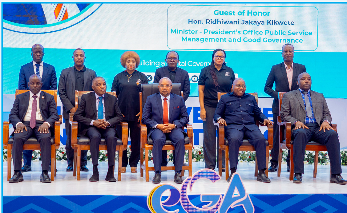
Waziri wa Nchi Ofisi ya Rais, Menejimenti ya Utumishi wa Umma na Utawala Bora Mhe. Ridhiwani Kikwete (Mb) (katikati) akiwa katika picha ya pamoja na wajumbe wa Bodi ya Wakurugenzi ya Mamlaka ya Serikali Mtandao (e-GA)