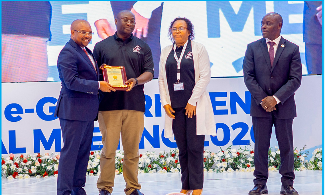
Waziri wa Nchi Ofisi ya Rais, Menejimenti ya Utumishi wa Umma na Utawala Bora Mhe. Ridhiwani Kikwete (Mb) (kushoto) akimkabidhi mwakilishi wa Halmashauri ya Wilaya ya Geita Tuzo ya mshindi wa kwanza wa Taasisi inayozingatia Sheria, Kanuni, Viwango na Miongozo ya Serikali Mtandao katika ukomavu wa TEHAMA hatua ya 3 (Level 3 of e-Government Capability Maturity)