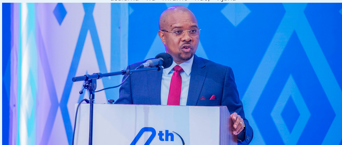
Waziri wa Nchi Ofisi ya Rais, Menejimenti ya Utumishi wa Umma na Utawala Bora Mhe. Ridhiwani Kikwete(Mb) akizungumza wakati wa kufunga kikao kazi cha 6 cha Serikali Mtandao Jijini Arusha.

“e-GA na washiriki mnayo kazi ya kuendelea kuelimisha umma hasa watumishi wa umma na Serikali juu ya jinsi ambavyo mifumo ya kidigitali imesaidia kwa namna moja au nyingine kutatua kero mbalimbali katika jamii yetu, tena kwa kutumia muda mfupi sana.”